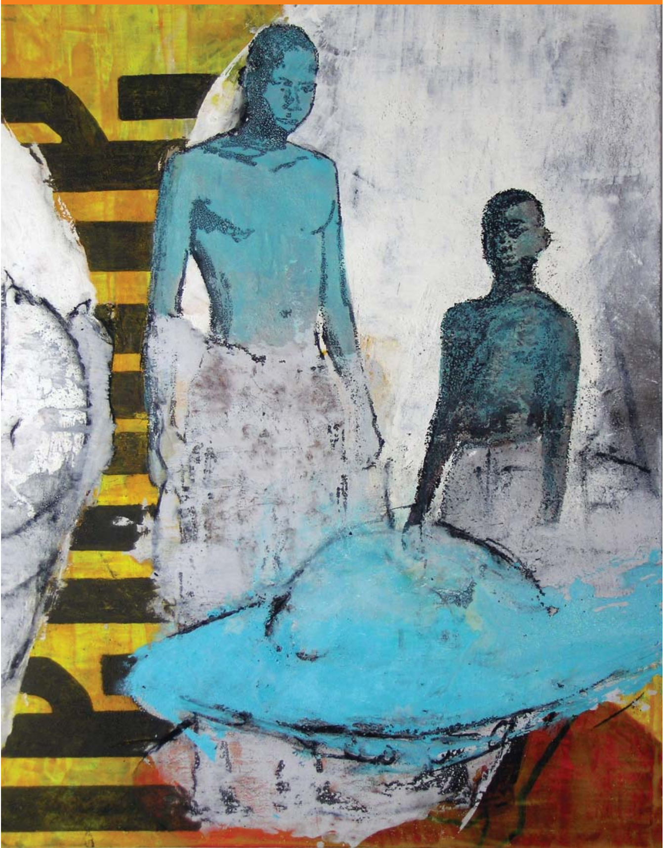
Daniel Kojo Schrade Afronauten Öl auf Leinwand 150x120 cm

der Zuwendung zu Geschäften mit asiatischen Partnern wurde in den letzten Jahren viel geschrieben. Auch in der Kunst liegt es ähnlich. China schiebt sich im Kunstmarkt mehr und mehr in eine Führungsposition. Waren 1997 noch keiner von ihnen in der Rangliste der 50 bestverdienenden