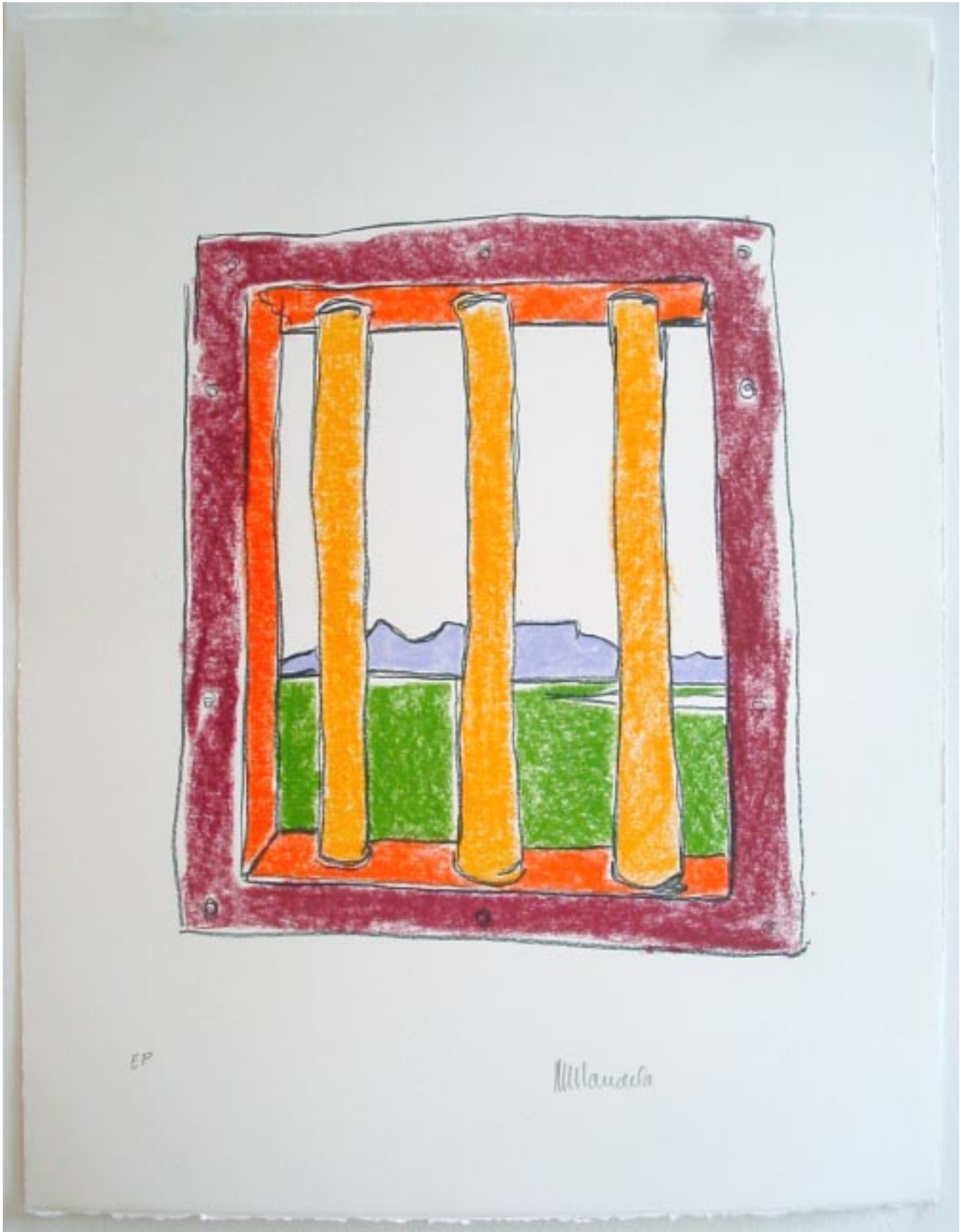
Prison Cell , Nelson Mandela

This sketch depicts a view of Table Mountain through the bars of a prison cell on Robben Island. In fact Table Mountain is not visible from the prison cell windows, however, the view depicted in this piece idealises one that resembled freedom and beauty to Nelson Mandela during his incarceration.